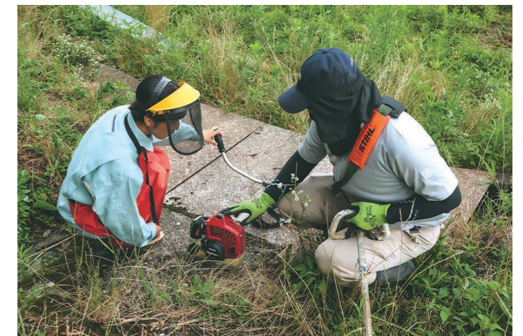
「孫の手プロジェクト」に関わる城西高校神山校の生徒が地域の方から草刈り機の使い方を教わっている

高齢者から高校生まで、これまで独自に活動していた人々が世代を超えて、ともに活動をしています。城西高校神山校で行われている「孫の手プロジェクト」を軸として、地域の草刈り支援を行う若者や高齢者の方々がともに働く場が生まれています。