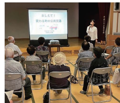
各公民館で開催された「変わる町の公共交通」の説明会

最も多かった困りごとは「移動の支援が必要」という声でした。役場と地元タクシー会社などが協議し、2023年度から、家まで迎えに来てくれて、行きたい場所に安価で行ける移動支援が始まることになりました。