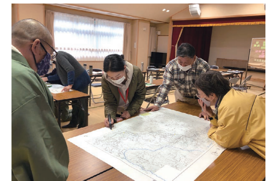
地図上で、ゴミ出しに困っている人の家の位置とゴミステーションまでの位置を確かめ、何ができるとよいか考えている(上分地区)

「ゴミ出しができなくて困っている」という声があり、地域住民や住民課の担当者と一緒に相談を重ねてきました。まずは地域の民生委員に相談しようということが共有されました。2022年度より、ゴミ出し支援の新たなサービスも生まれています。