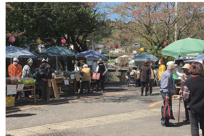
鬼籠野地区の地域住民による買い物支援の取り組み(さいさい市)

「近くで買い物できるお店がない」「移動手段がなく、買い物に困っている」「普段は家族が支援してくれて助かっているが、たまには自分の目で見て買いたい」など、買い物は暮らしの中の楽しみであり、生活に関わる大事なところ。地域住民が主体となって取り組める支援とは何か、場づくりを重ねています。